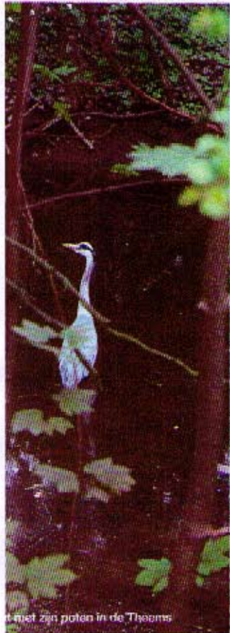
met zijn poten in de Theems