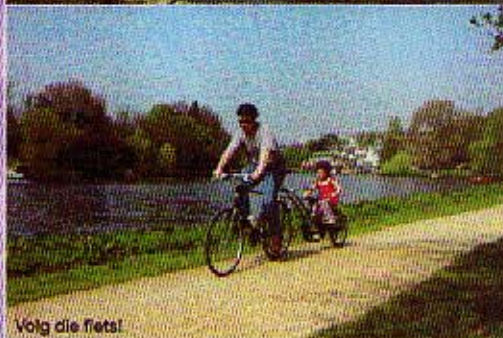
Volg die fiets!