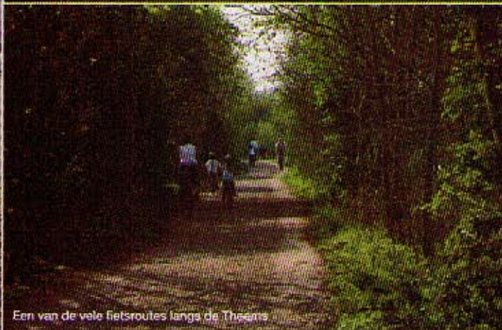
Een van de vele fietsroutes langs de Theems