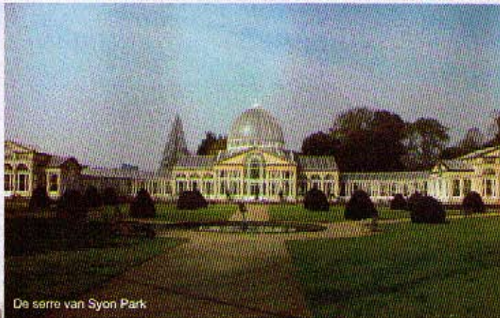
De serre van Syon Park