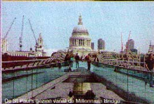
De St. Pauls gezien vanaf de Millennium Bridge