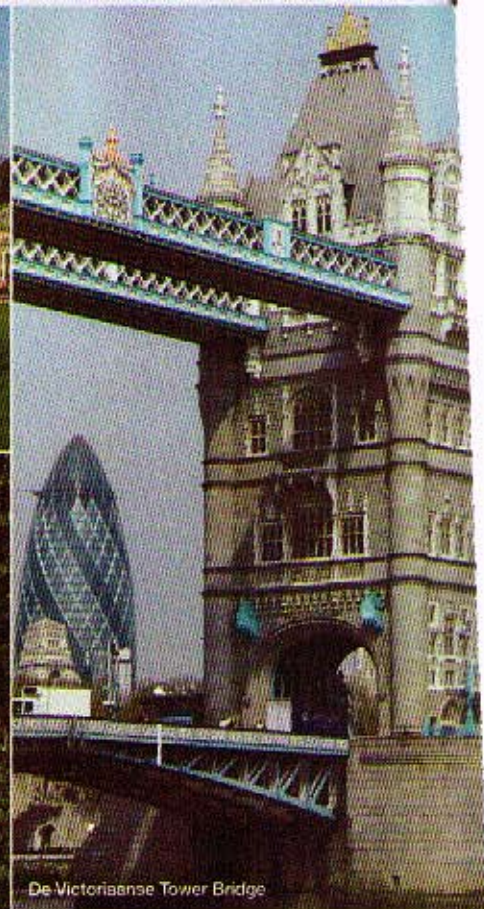
De Victoriaanse Tower Bridge

dan 40.000 verschillende planten groeien hier. Eenmaal de fiets van de boot geladen, heerst er rust. Een smal verhard zandpad loopt vrijwel direct naast de rivier. Een eekhoortje schiet net voor het fietswiel weg. Even verderop staat een reiger met zijn poten in de Theems. Vogeltjes fluiten. De stad is hier snel vergeten.