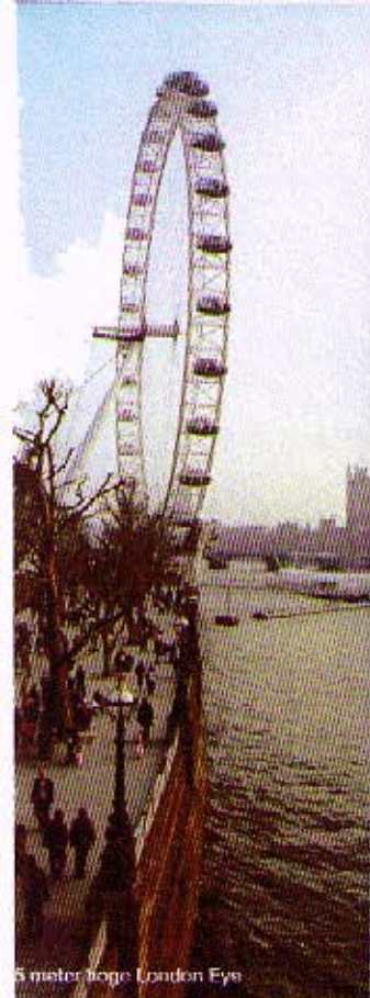
5 meter hoge London Eye