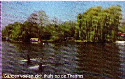
Garzen voelen zich thuis op de Theems